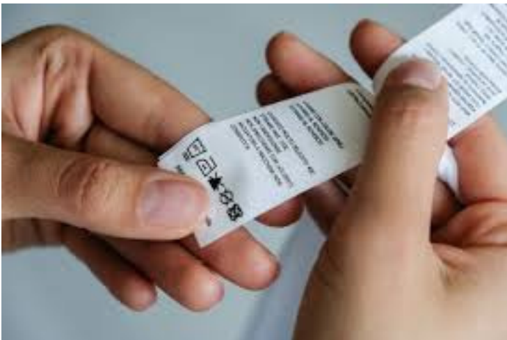
Figure interessate: responsabili Controllo Qualità, Responsabili di produzione, Funzioni tecniche e commerciali