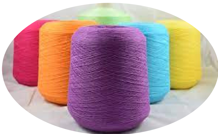
Figure interessate: Tecnici di produzione, ufficio stile, funzioni commerciali