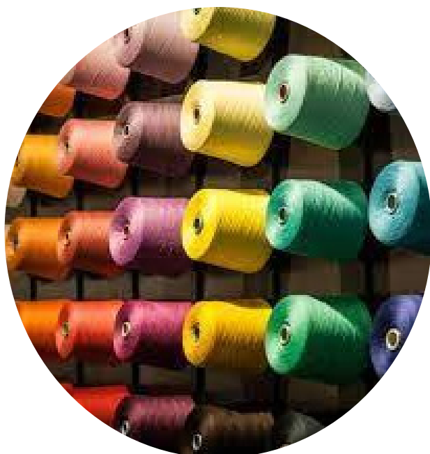
Figure interessate: tecnici analisti dei tessuti, creativi e venditori che necessitano di formazione sulle innovazioni di prodotto di processo.