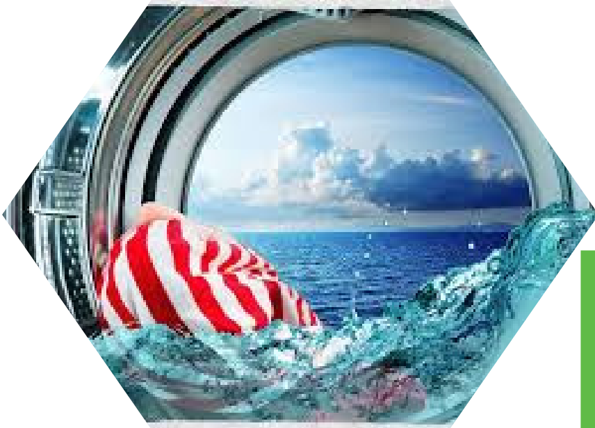
Figure interessate: direzione, Chemical Manager, RSPP, responsabili qualità, ambiente, salute e sicurezza, responsabili di produzione