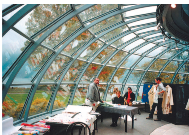
Silvano Bussetti nel suo stand a Villa Erba

I segnali arrivati con le prenotazioni per la prossima esposizione hanno dato ragione alle scelte dei disegnatori. Sono infatti tornati studi europei di rilevante importanza così come invece hanno