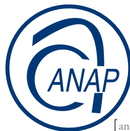
[ anap ]