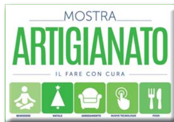
[ mostra dell'artigianato ]