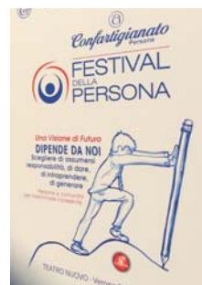
[ festival della persona ]