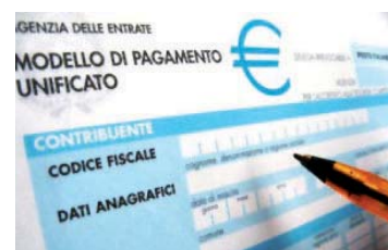
[ novità fiscali ]