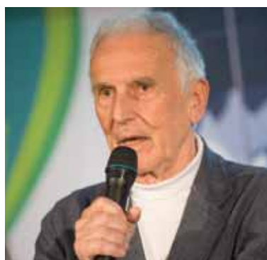
Il Professor Silvio Garattini