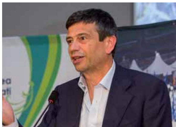
Il Ministro delle Infrastrutture, Maurizio Lupi