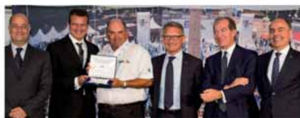
SNC - TASELL Como