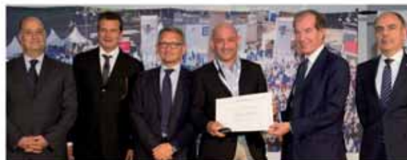
VINICOLA BRANCA Mariano Comense