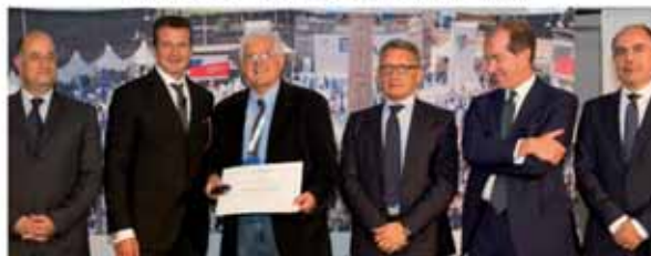
AUDIO VIDEO ITALIANA Como