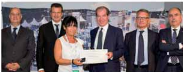
BARBER'S SHOP Montorfano