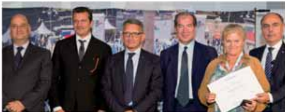
CORTI ELLI SNC Merone