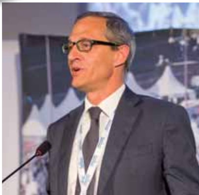
MARIO LUCINI Sindaco di Como

Nelle difficoltà di questi momenti, è necessario fare scelte difficili che competono ad ogni ambito della nostra società – ha sottolineato il Sindaco di Como - sia nel privato che nel pubblico.