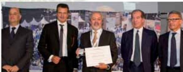
ADELIO LATTUADA SRL Carbonate

Premio riservato alle imprese artigiane in attività, associate a Confartigianato Imprese Como da oltre 20 anni in forma continuativa