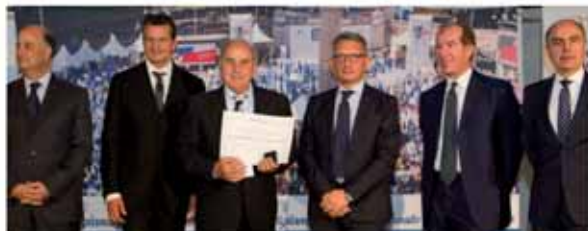
AUTOTRASPORTI NAVA MARIO & C. SNC Erba