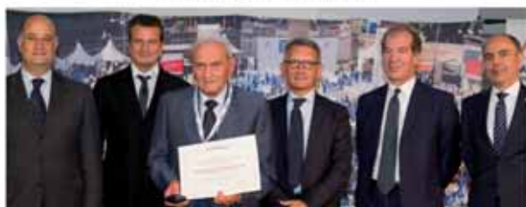
RONCHETTI & PONTIGGIA SAS Albese con Cassano