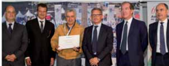
LA.RE.CO. SRL Veniano