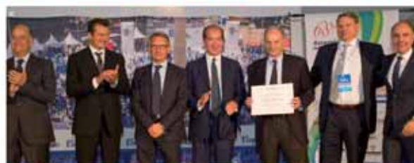
ANTONIO COSTA & C. SNC Rovellasca