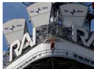
[canone rai speciale]