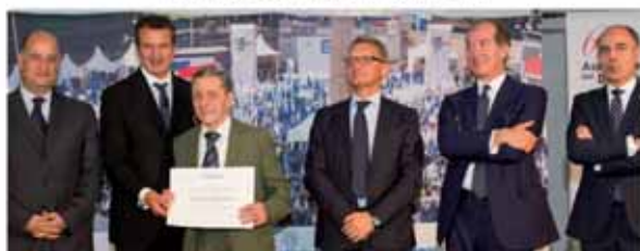
ARTIGIANA MONGUZZESE Monguzzo