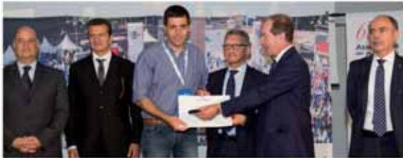
NUOVA GAMMA GAS San Fedele Intelvi