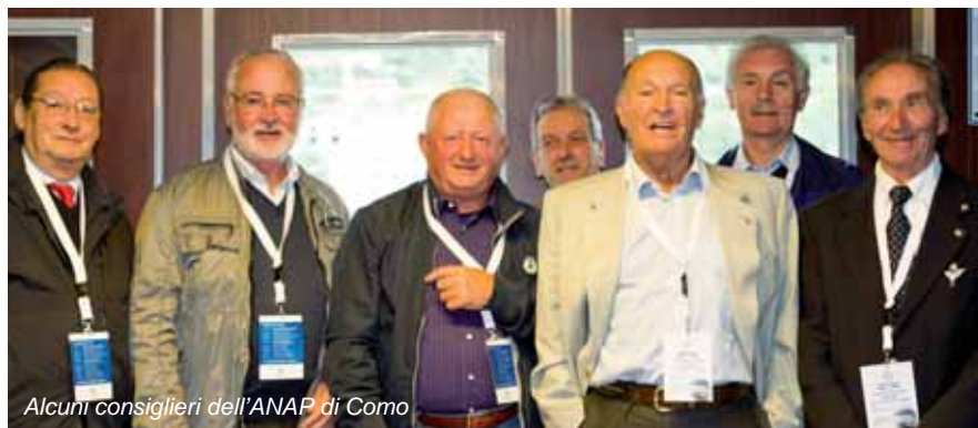
Alcuni consiglieri dell'ANAP di Como