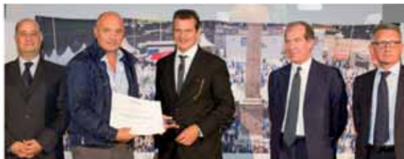
AUTOCARROZZERIA TECNOCAR Alzate Brianza