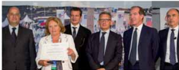
EBANISTERIA CATTANEO SNC Figino Serezza