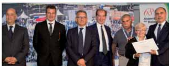
AGE GROUP SNC Lurago d'Erba

Premio riservato alle imprese artigiane in attività, associate a Confartigianato Imprese Como da oltre 40 anni in forma continuativa