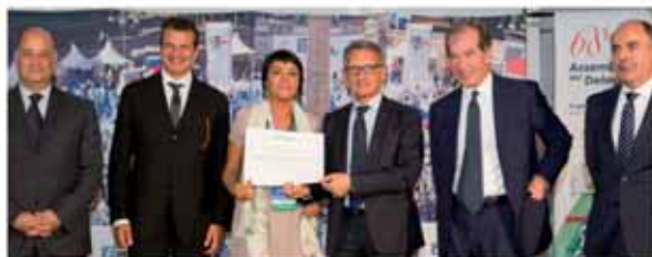
SORELLE FUMAGALLI ACCONCIATURE SNC Mariano Comense