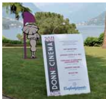
[donne e cinema]

confartigianatoimprese.it - info@confartigianatocomo.it