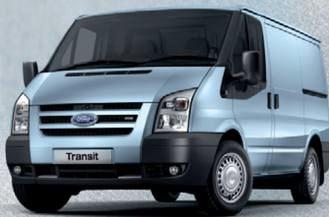
Transit Van 2.2 TDCi con clima e radio CD € 14.000 per tutti

Oggi su tutta la gamma Transit 200.000 km o 5 anni di garanzia.*