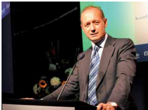
Il Sindaco di Como Stefano Bruni