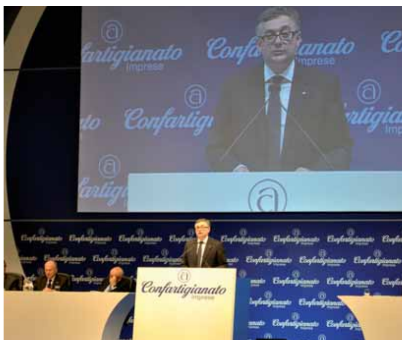
Il Presidente Nazionale di Confartigianato Imprese Giorgio Guerrini

nomica globale, Europea e nazionale, sottolineando gli aspetti più significativi che hanno caratterizzato la crisi economica degli ultimi anni. Da parte sua, il presidente nazionale di Confartigianato Guerrini, ha spaziato con la sua relazione su tutti i temi che riguardano l'artigianato, sollecitando maggiore attenzione alla categoria, ma soprattutto un'inversione di tendenza verso i veri problemi del Paese, sui quali va la massima concentrazione di tutte le componenti: politiche, sociali ed economiche.