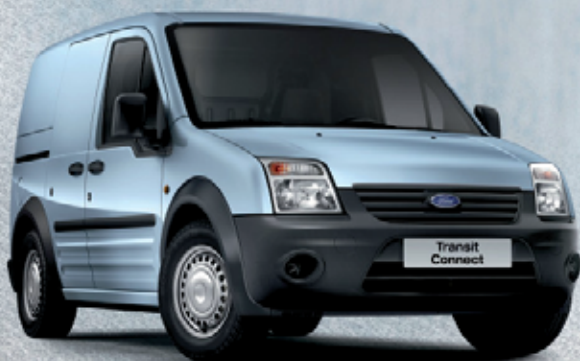
Transit Connect 1.8 TDCi con clima e radio CD € 9.750 per tutti