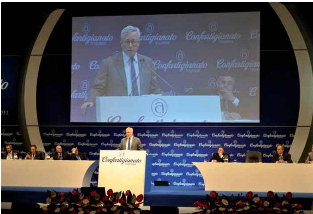
Il Ministro dell'Economia Giulio Tremonti

nomica globale, Europea e nazionale, sottolineando gli aspetti più significativi che hanno caratterizzato la crisi economica degli ultimi anni. Da parte sua, il presidente nazionale di Confartigianato Guerrini, ha spaziato con la sua relazione su tutti i temi che riguardano l'artigianato, sollecitando maggiore attenzione alla categoria, ma soprattutto un'inversione di tendenza verso i veri problemi del Paese, sui quali va la massima concentrazione di tutte le componenti: politiche, sociali ed economiche.