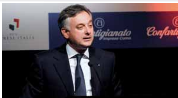
Giorgio Guerrini, Presidente Nazionale di Confartigianato Imprese, durante il suo discorso

La soluzione consiste nell'abbandonare il vecchio schema del