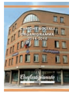
[inserto: Cariche Sociali]