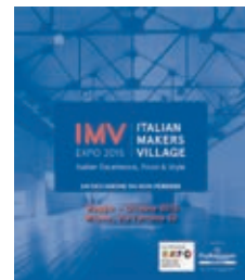
[Expo: Italian Makers Village]