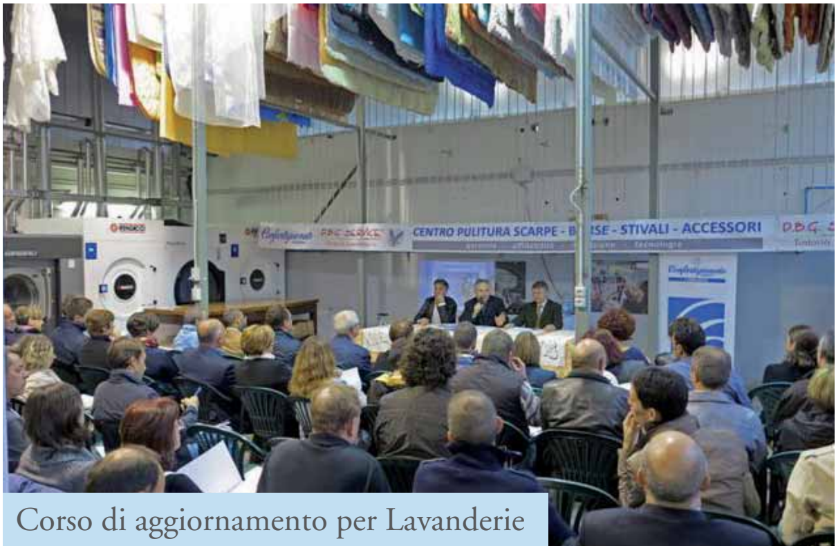
Corso di aggiornamento per Lavanderie