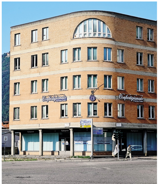
La sede di Confartigianato Como